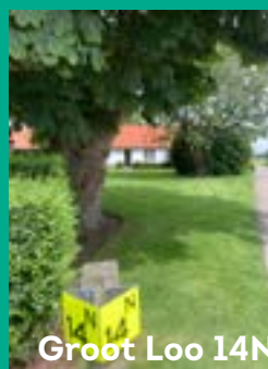
Groot Loo 14N

Tussen het dorp en de Duitse linies waren mijnevelden aangelegd en er volgde een artillerieduel dat ongeveer drie weken duurde en dat aan tien burgers het leven kostte. Toen de eerste doden vielen, trok een groot deel van de bevolking weg; die van Hilvarenbeek naar Hooge en Lage Mierde en die van de Biest naar Moergestel.